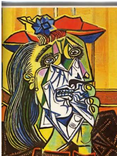
La femme qui pleure