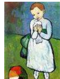
L'enfant au pigeon