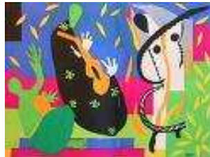
La tristesse du roi