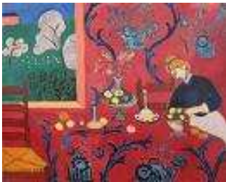
La chambre rouge