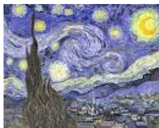
La nuit étoilée