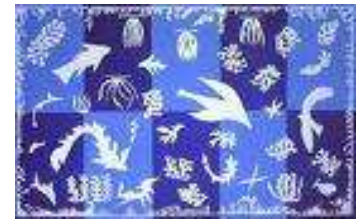
Polynésie: la mer