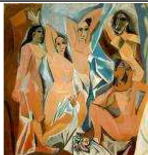
Les demoiselles d'Avignon