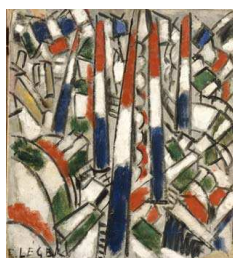
Le 14 juillet